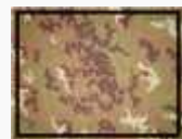
milite (nessun distintivo di grado)